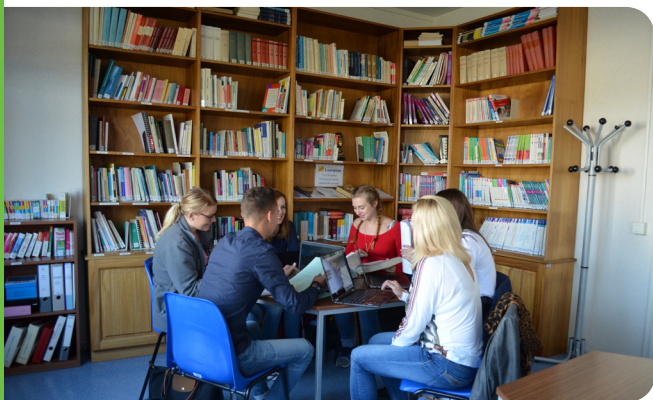
Le centre de documentation de l'IFSI de Sarreguemines

4 200 heures de formation sur 3 ans (6 semestres), réparties en 2 100 heures théoriques et 2 100 heures de stages. La formation est articulée autour des 10 compétences infirmières qui s'acquièrent grâce à l'alternance entre les enseignements théoriques à l'IFSI et les stages en milieu professionnel.